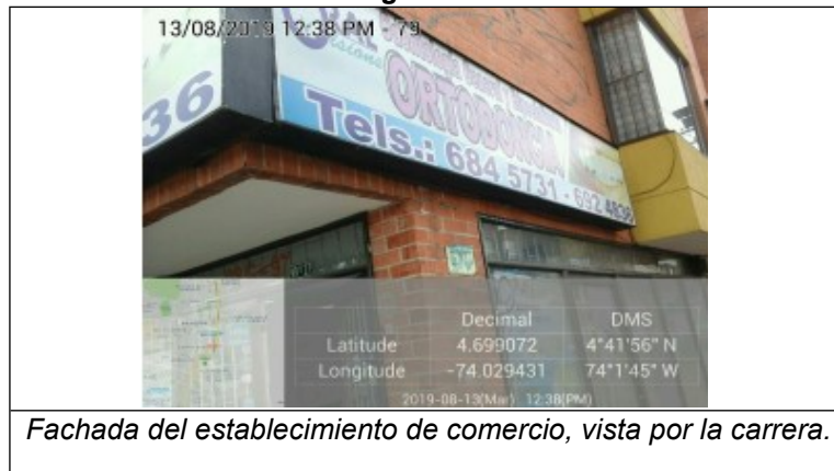
Fachada del establecimiento de comercio, vista por la carrera.