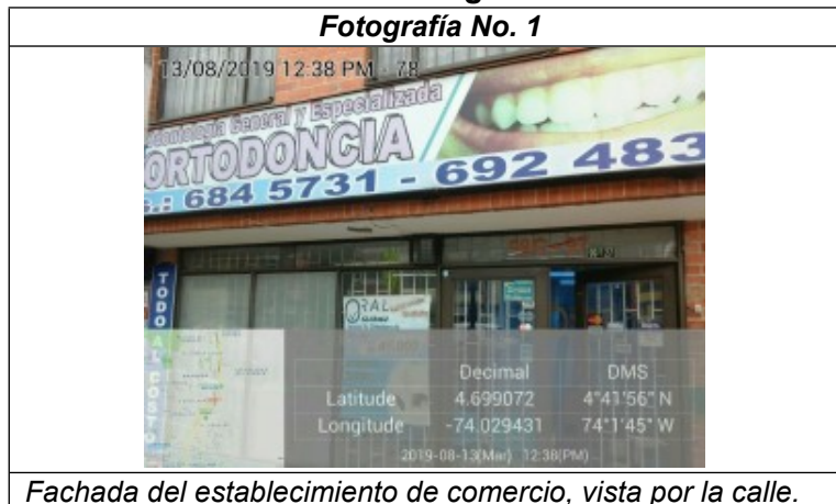
Fachada del establecimiento de comercio, vista por la calle.